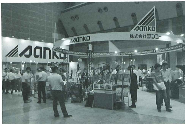
サンコーのブースで展示が行われた。

オプションとなっている「プリウス 20 系エア抜き機能」はSDカードにて提供される。「イーグルキャッチ」の本体にSDカードを挿入して使用する。料金は1万4,700円。